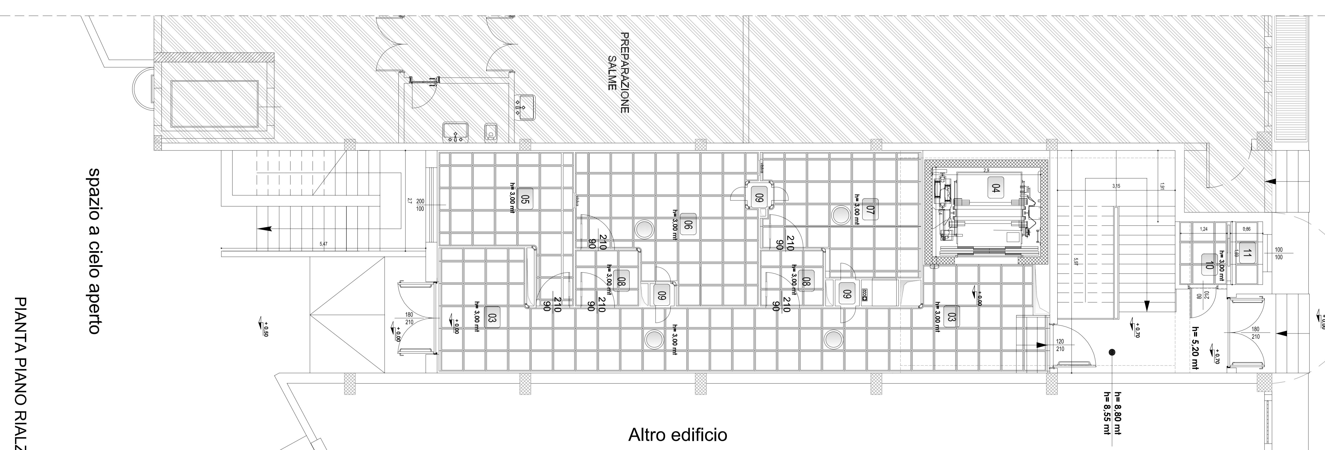
PIANTA PIANO RIALZATO